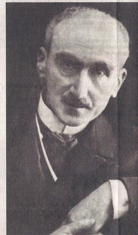
HENRI BERGSON.